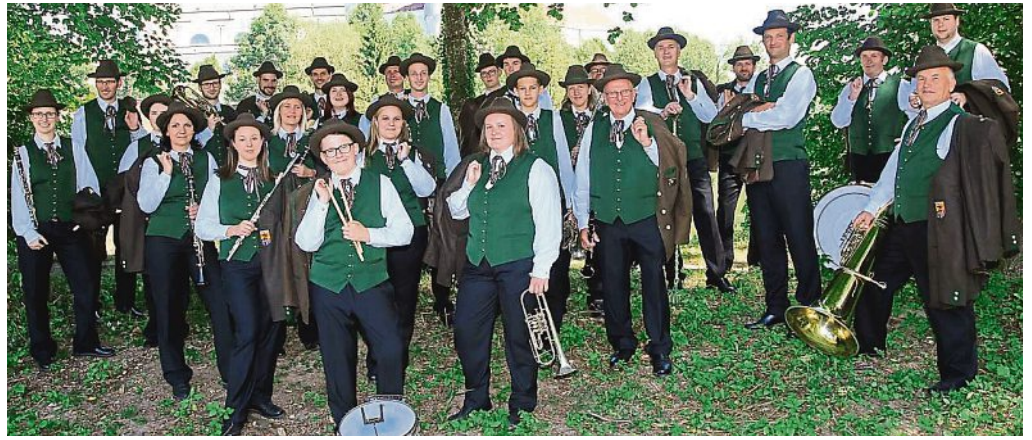
Die Hubertusmusikkapelle Attnang-Puchheim spielt am 3. Juli auf.

Am Samstag, 2. Juli , wird es auf dem Puchheimer Volks-