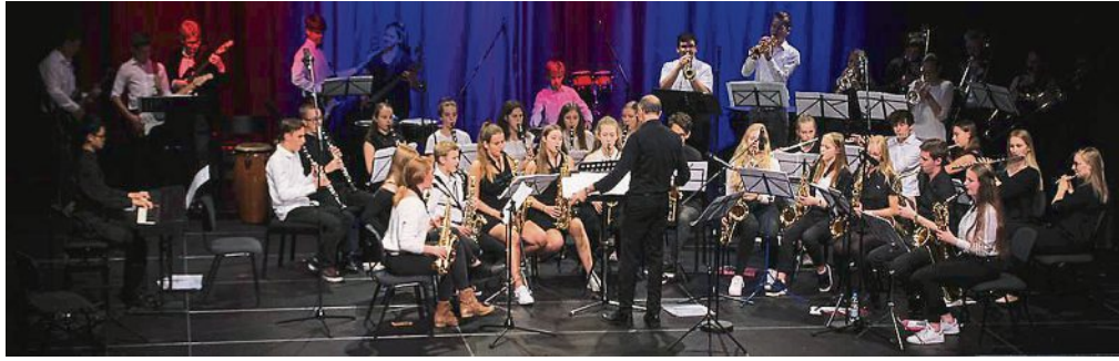
Die Jazzabteilung des Gymnasiums Puchheim präsentiert sich beim Stadtfest.

Willkommen zum 2. American Roots Festival am Independence Day! Von Stringband-Music über Blues bis hin zu Americana erwarten Sie an diesem